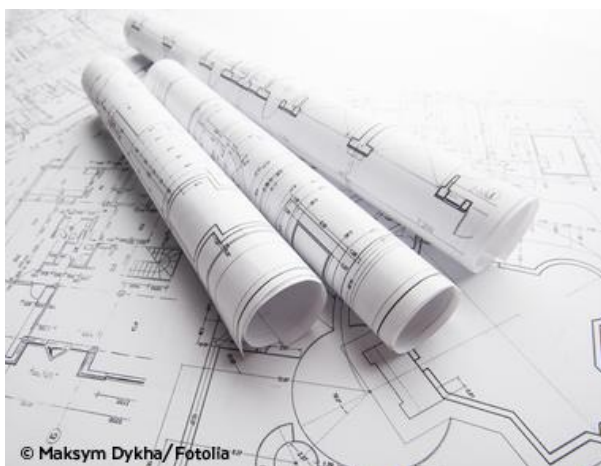
Mobilität von Anfang an mitdenken und -planen.